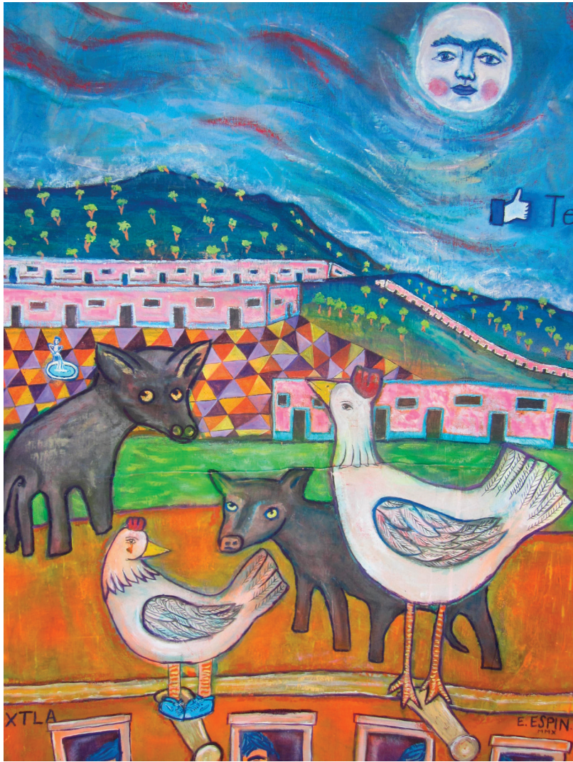
Perros Coyotes / La frontera. Óleo sobre tela, 90 x 120 cm, 2009