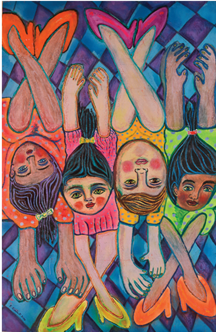
Las cuatro estaciones. Óleo sobre tela, 90 x 120 cm, 2009