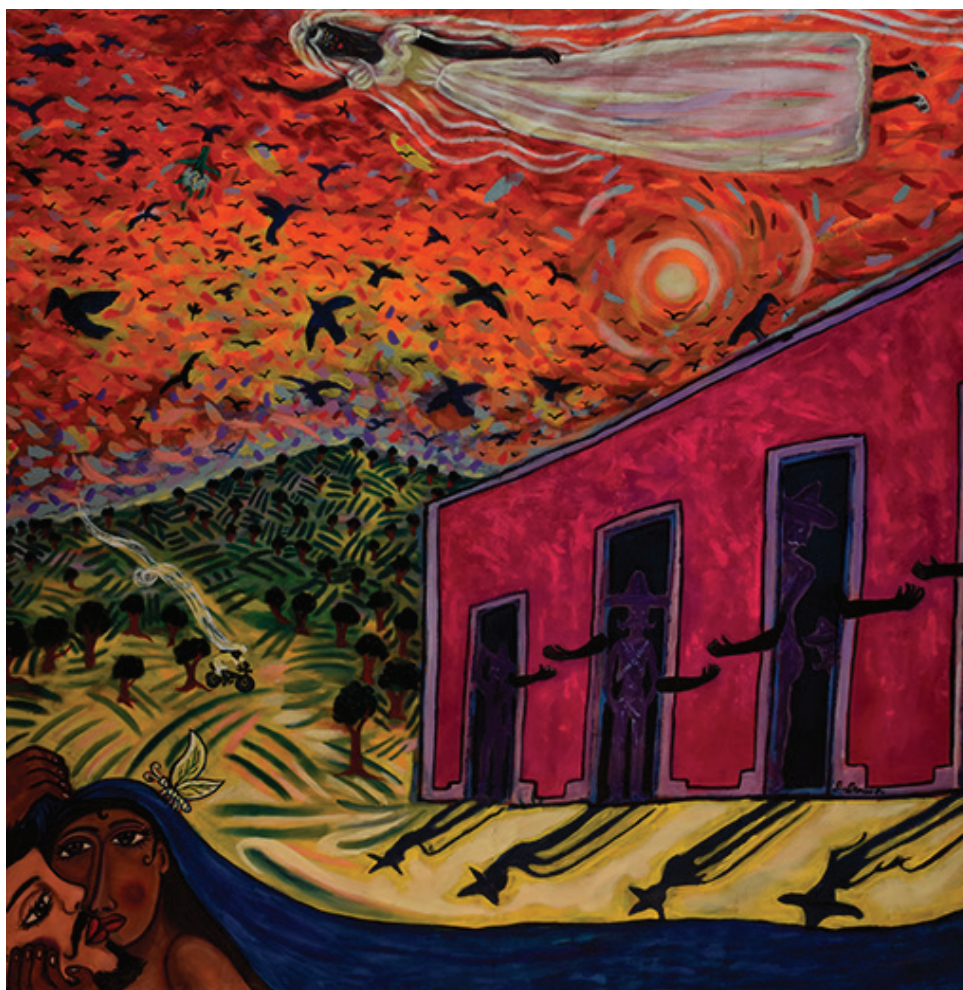
El beso (Díptico/ parte I) . Óleo sobre tela, 90 x 120 cm, 2009