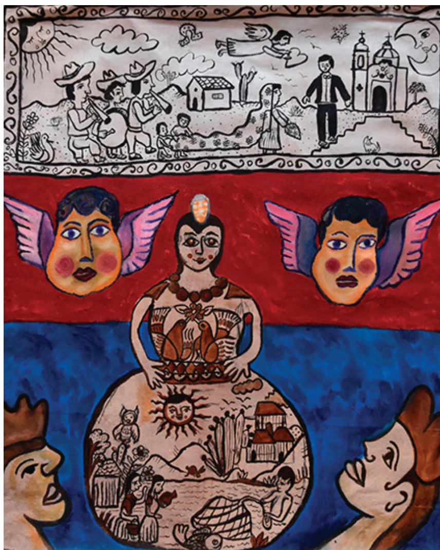
Xalitla y Oapan. Óleo sobre tela, 90 x 120 cm, 2015