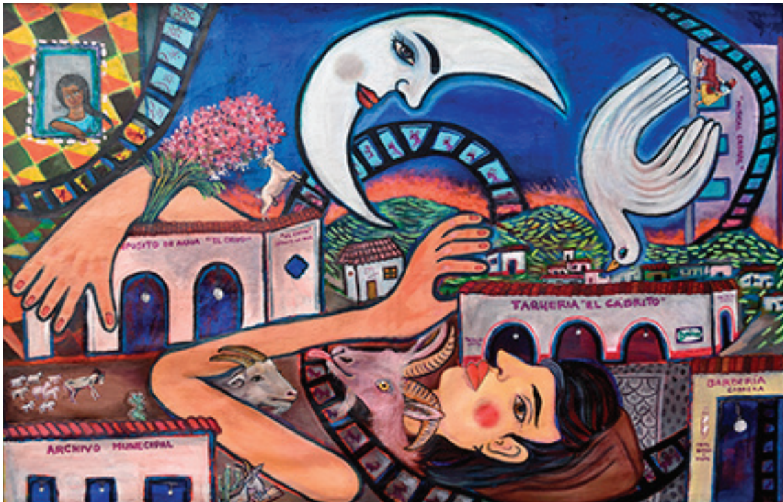
Chivero. Óleo sobre tela, 90 x 120 cm, 2009