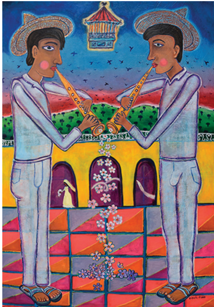
Los músicos. Óleo sobre tela, 90 x 120 cm, 2009