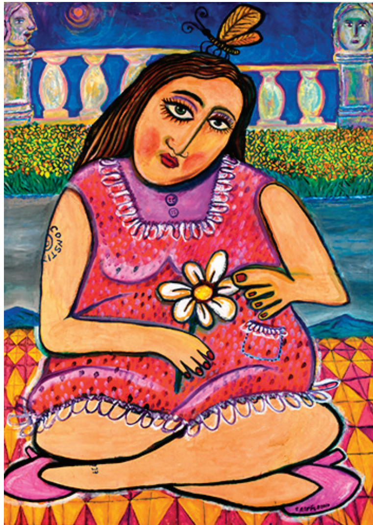
Constitución. Óleo sobre tela, 90 x 120 cm, 2009