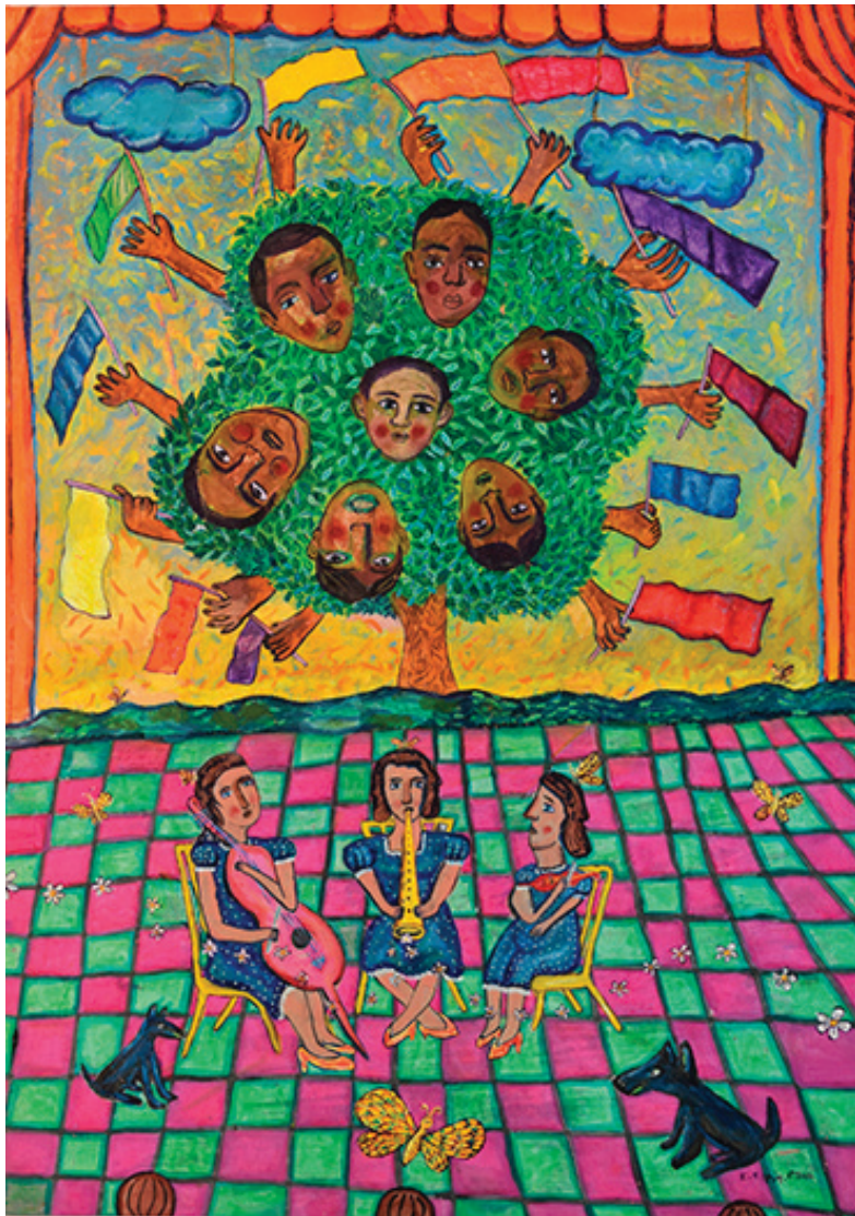
Alma de México. Óleo sobre tela, 90 x 120 cm, 2009