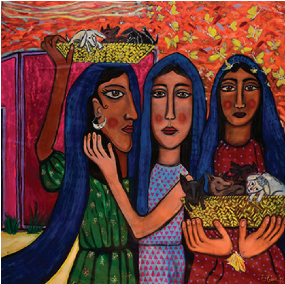
El beso (Díptico/ parte II) . Óleo sobre tela, 90 x 120 cm, 2009