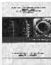
Nematode parasites of freshwater fish in Mexico: key to species, description and distribution Juan Manuel Caspeta-Mandujano México, UAEM, 2005

En este campo también el Derecho debe ser el gran organizador social, pues necesita imperar la ley del más débil, no la ley del más fuerte; así, los autores definen la posición de que los menores infractores merecen, conforme a la justicia distributiva, una educación y reeducación de elevada calidad que seguramente la misma sociedad les negó desde su nacimiento. Los autores son investigadores de la Facultad de Derecho.