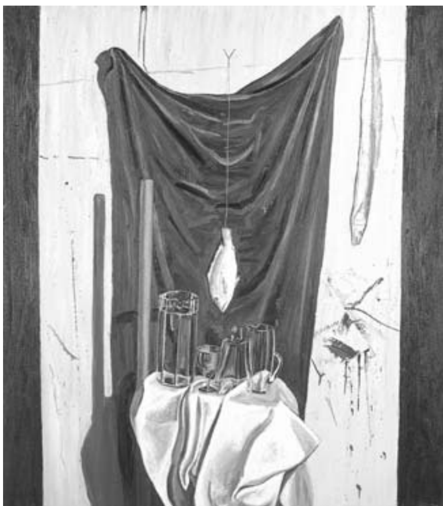
Lo ligero y lo pasado, 1994