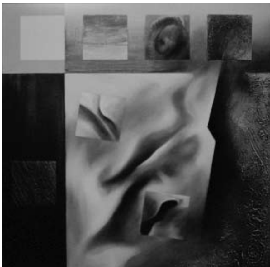
La piel , 1996