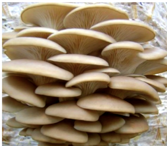
Figura 2 Basidiomas del género Pleurotus

nutricional. Cabe mencionar que, de manera natural o accidental, los animales también ingieren hongos como parte de su alimentación; por ejemplo, los macromicetos como las setas ( Pleurotus spp.), que crecen y se encuentran entre la pastura (Van der Heijden et al., 2015; Guzmán, 1979) (figura 2).