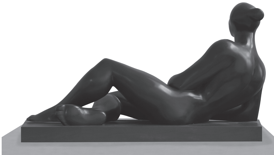
Mujer reclinada , piedra artificial, 90 x 48 x 41 cm, 1968