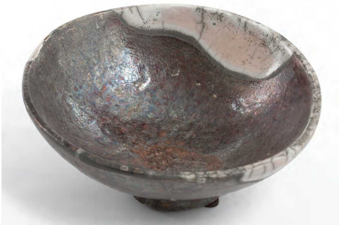
Vasija. Barro de Zacatecas, 17 x 18 cm, 2011