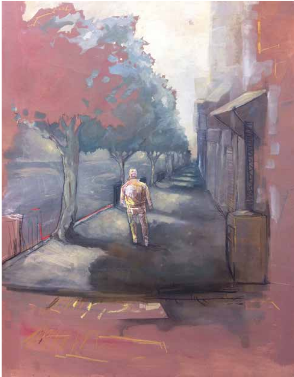
3. Serie Tránsito . Técnica mixta, 95 x 122 cm, 2016