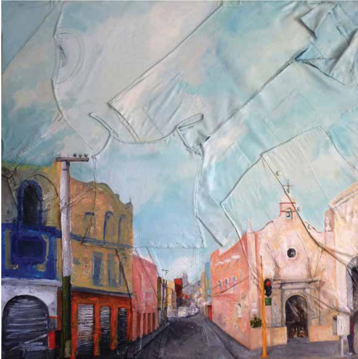
Degollado . Óleo sobre ropa, 122 x 122 cm