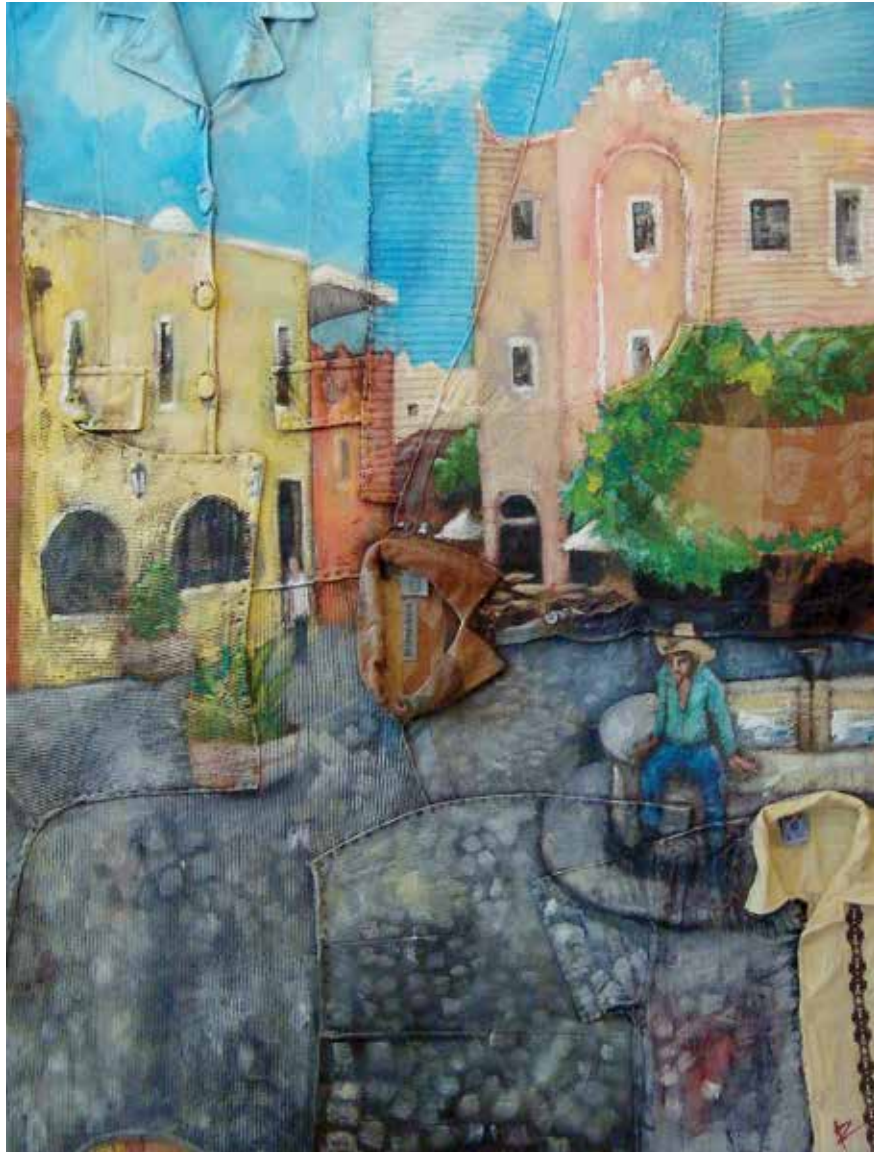
Plazuela del Zacate. Mixta sobre ropa, 122 x 100 cm