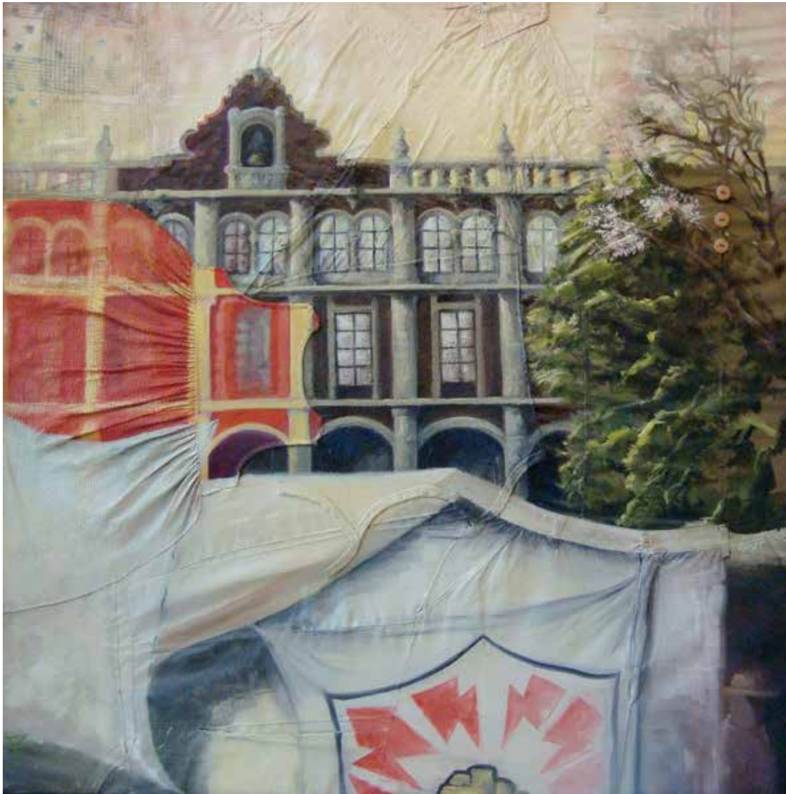
Palacio de Gobierno. Óleo sobre ropa, 122 x 122 cm