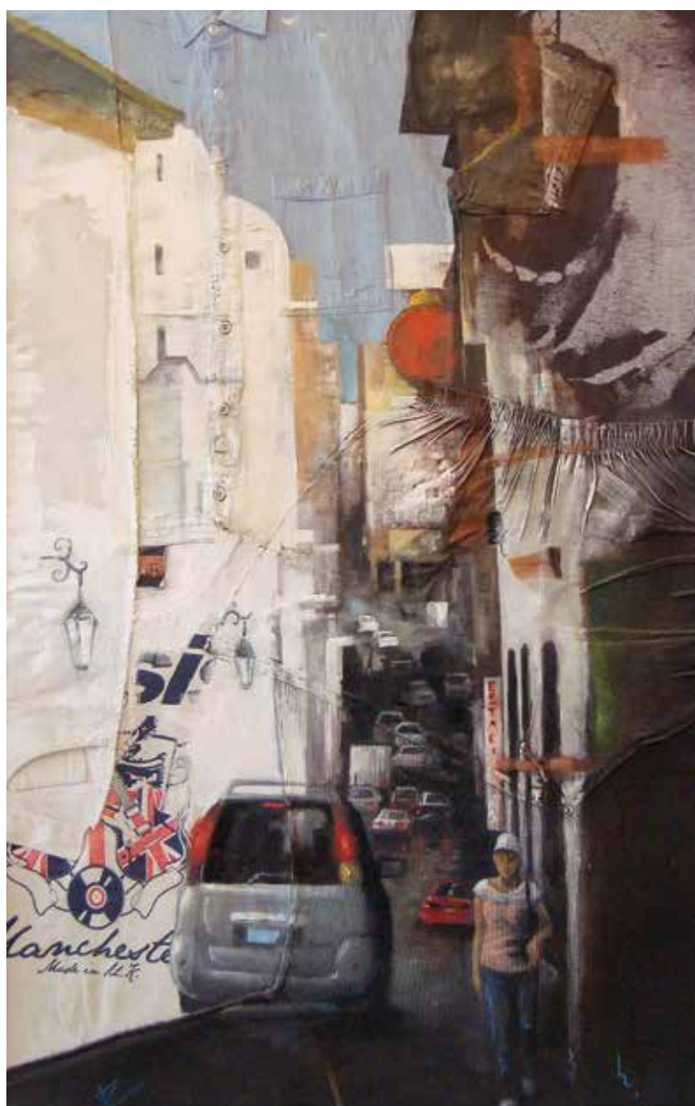
Guerrero. Óleo sobre ropa, 122 x 80 cm