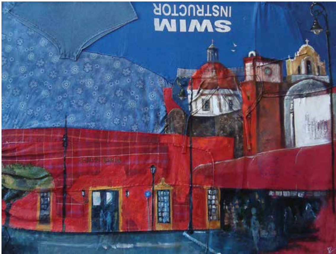
Vista hacia el Jardín Borda. Óleo sobre ropa, 123 x 94 cm

* Augusto Rubio. Artista visual originario de Morelos. Cursó estudios profesionales en la Facultad de Artes de la Universidad Autónoma del Estado de Morelos (UAEM). Se especializó en medios digitales y técnicas plásticas tradicionales. Desde 2010 se desempeña como docente en el Instituto Tecnológico y de Estudios Superiores de Monterrey (ITESM), donde imparte asignaturas relacionadas con las artes. En el mismo año obtuvo la beca del Programa de Estímulos a la Creación y Desarrollo Artístico (PECDA), en la categoría Jóvenes Creadores. Ha colaborado en diferentes proyectos artísticos y exposiciones individuales y colectivas en Morelos y en el país. Como artista visual, su proceso creativo tiene dos vertientes: pintura e ilustración. En su obra se aprecia recurrentemente la temática del paisaje urbano, donde encuentra indicios sobre la relación entre identidad y entorno.