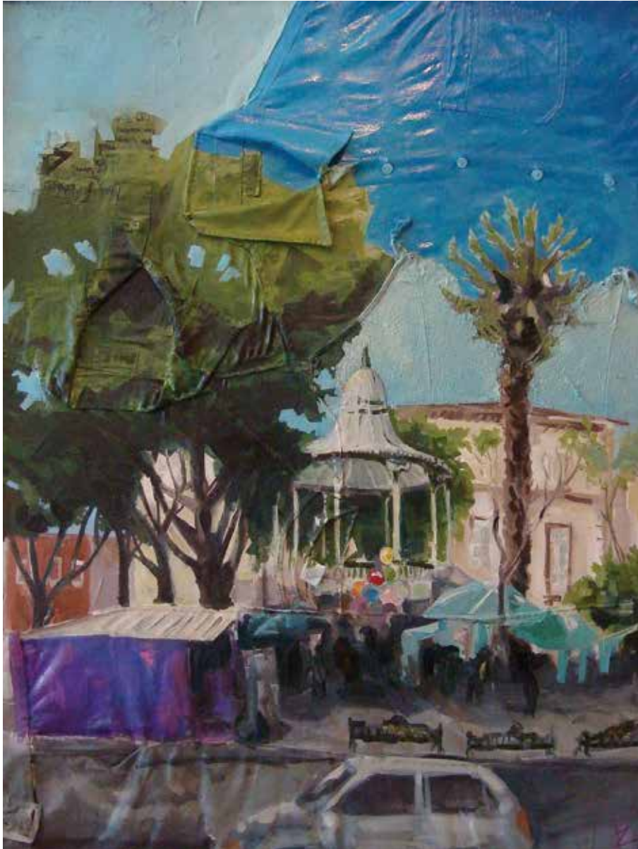
Jardín Juárez. Óleo sobre ropa, 100 x 95 cm