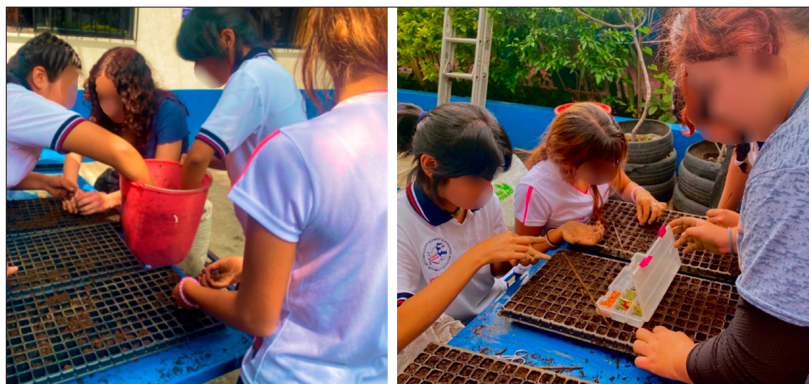
Figura 1 Preparación de sustrato y siembra de semillas por alumnos de la preparatoria