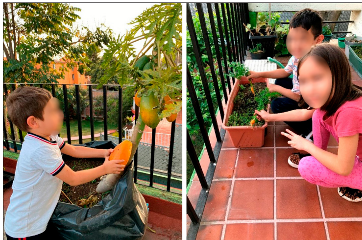
Figura 3 Cosecha de frutos y vegetales en un huerto urbano