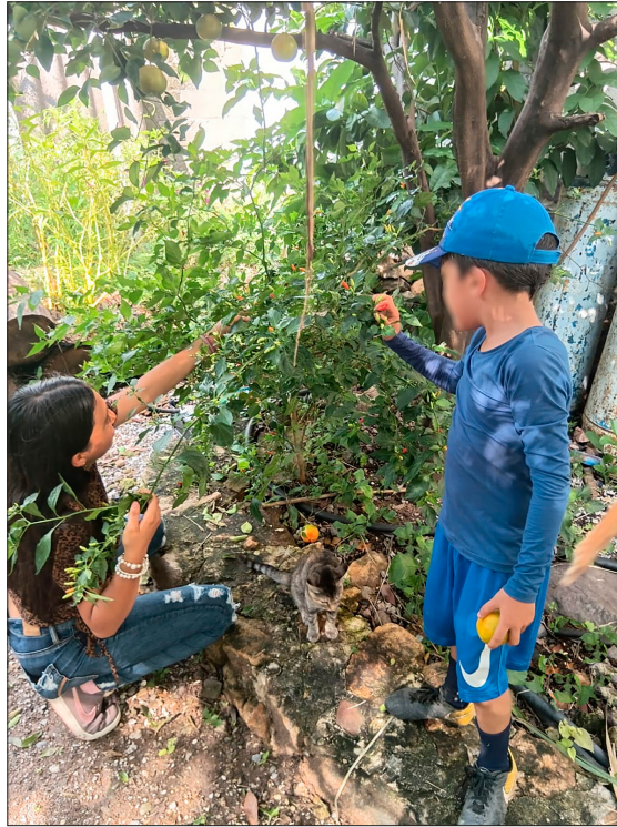
Figura 2 Recolección en la REBIOSH