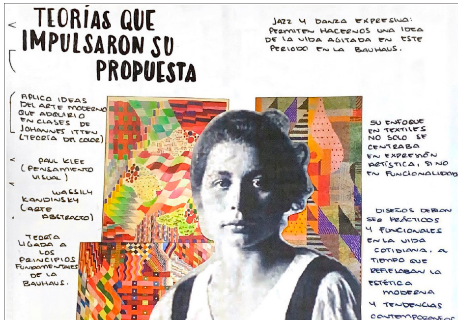
Figura 3 Aportación de las mujeres al diseño de textiles